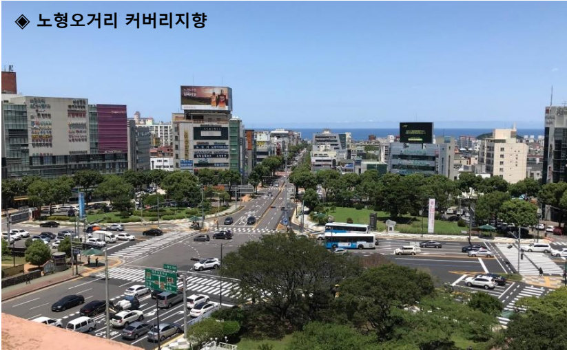
◆ 노형오거리 커버리지향

드림타워 준공으로 제주의 대표적 글로벌 스트리트로 변모하는 노형오거리에 최적 규격과 최고 화질의 뉴미디어 공장과 중문관광단지, 대표 관광지와 영어교육도시, 골프장을 연결하는 평화로 초입